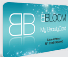
CARTES DE FIDÉLITÉ