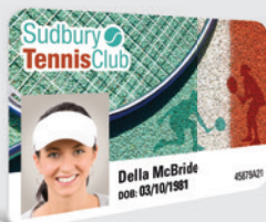
CARTES DE MEMBRE