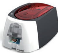
IMPRIMANTE A CARTES BADGY