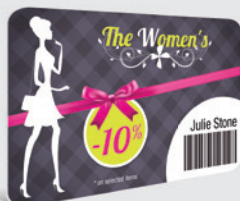
CARTES CADEAUX & PROMOTIONNELLES