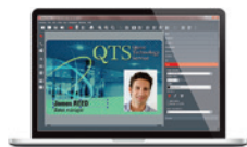
LOGICIEL DE PERSONNALISATION DE CARTES EVOLIS BADGE STUDIO®